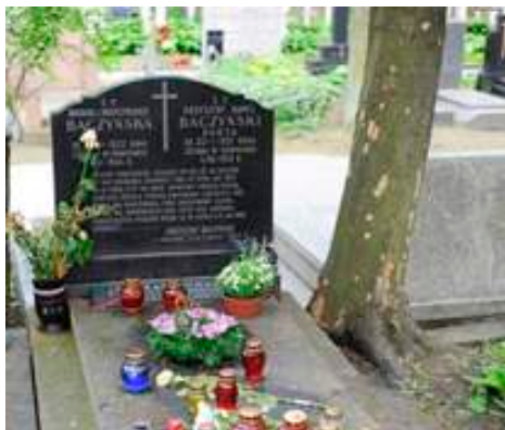
Grób Barbary i Krzysztofa Baczyńskich